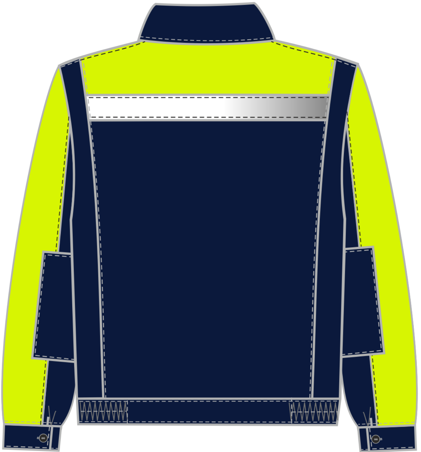
Рис. 2. Эскиз костюм Сфера т.синий/лимонный. Куртка, вид сзади.