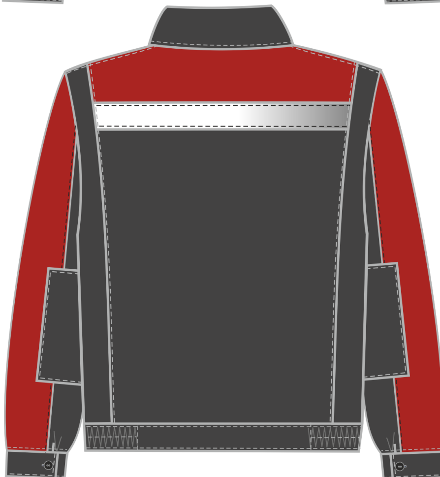
Рис. 4. Эскиз костюм Сфера , т.серый/красный. Куртка, вид спереди и сзади.