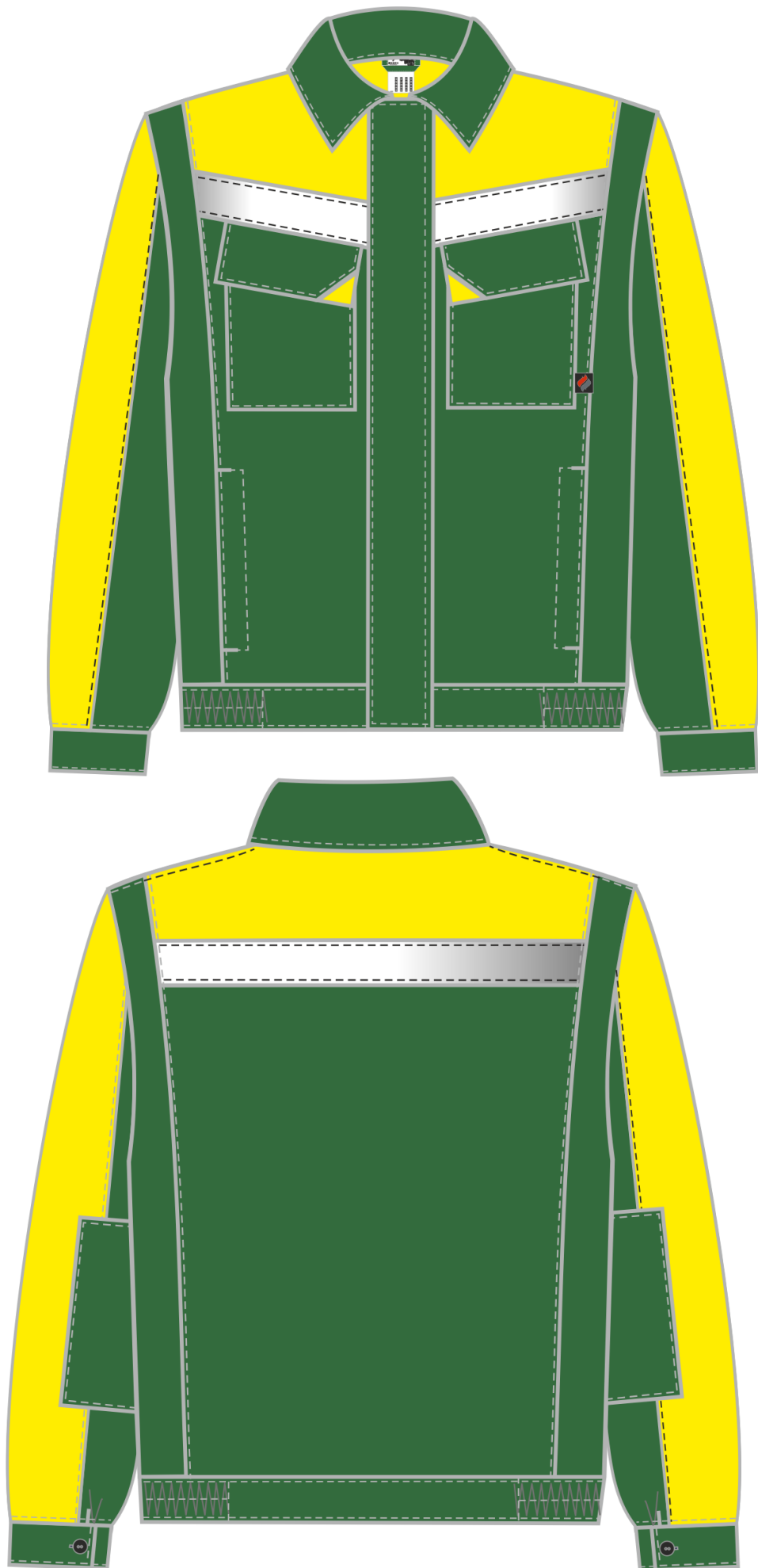
Рис. 6. Эскиз костюм Сфера , зеленый/желтый. Куртка, вид спереди и сзади.