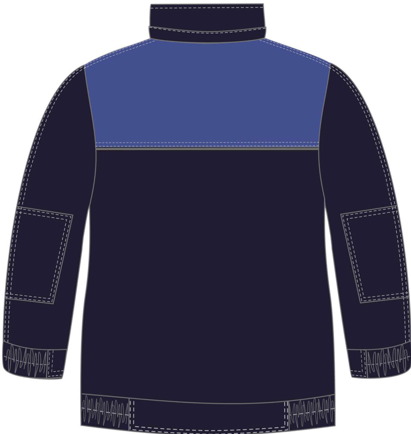
Рис. 4. Эскиз Куртка зимняя укороченная Фаворит (тк.Смесовая,240), т.синий/васильковый/серый вид сзади.