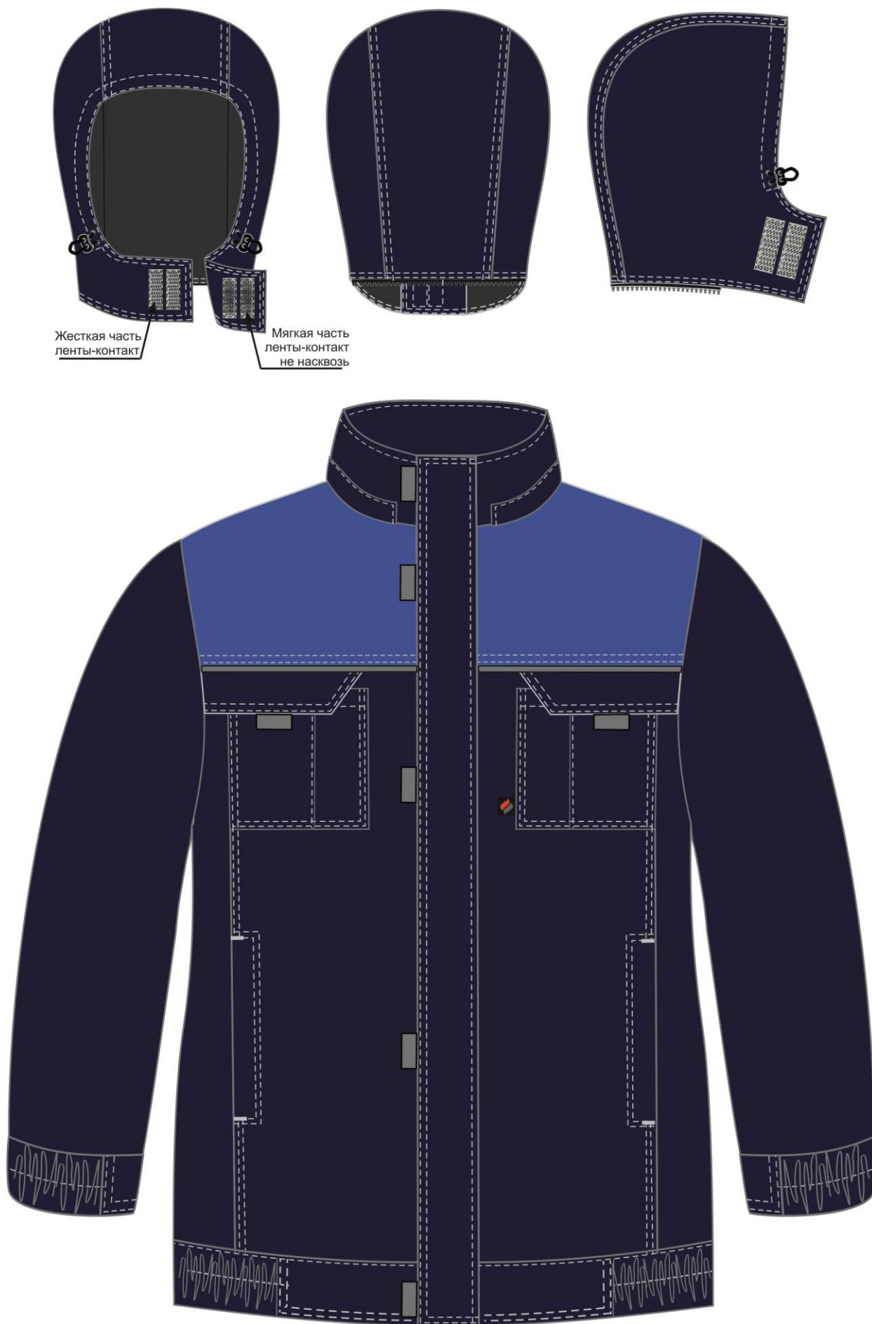
Рис. 3. Эскиз Куртка зимняя укороченная Фаворит (тк.Смесовая,240), т.синий/васильковый/серый вид спереди