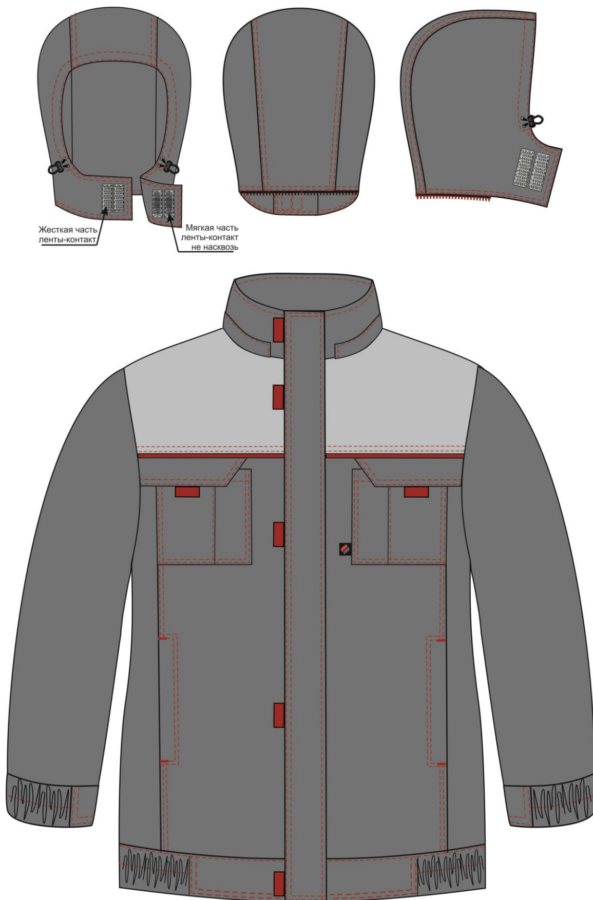
Рис. 1. Эскиз Куртка зимняя укороченная Фаворит (тк.Смесовая,240), т.серый/св.серый/красный вид спереди