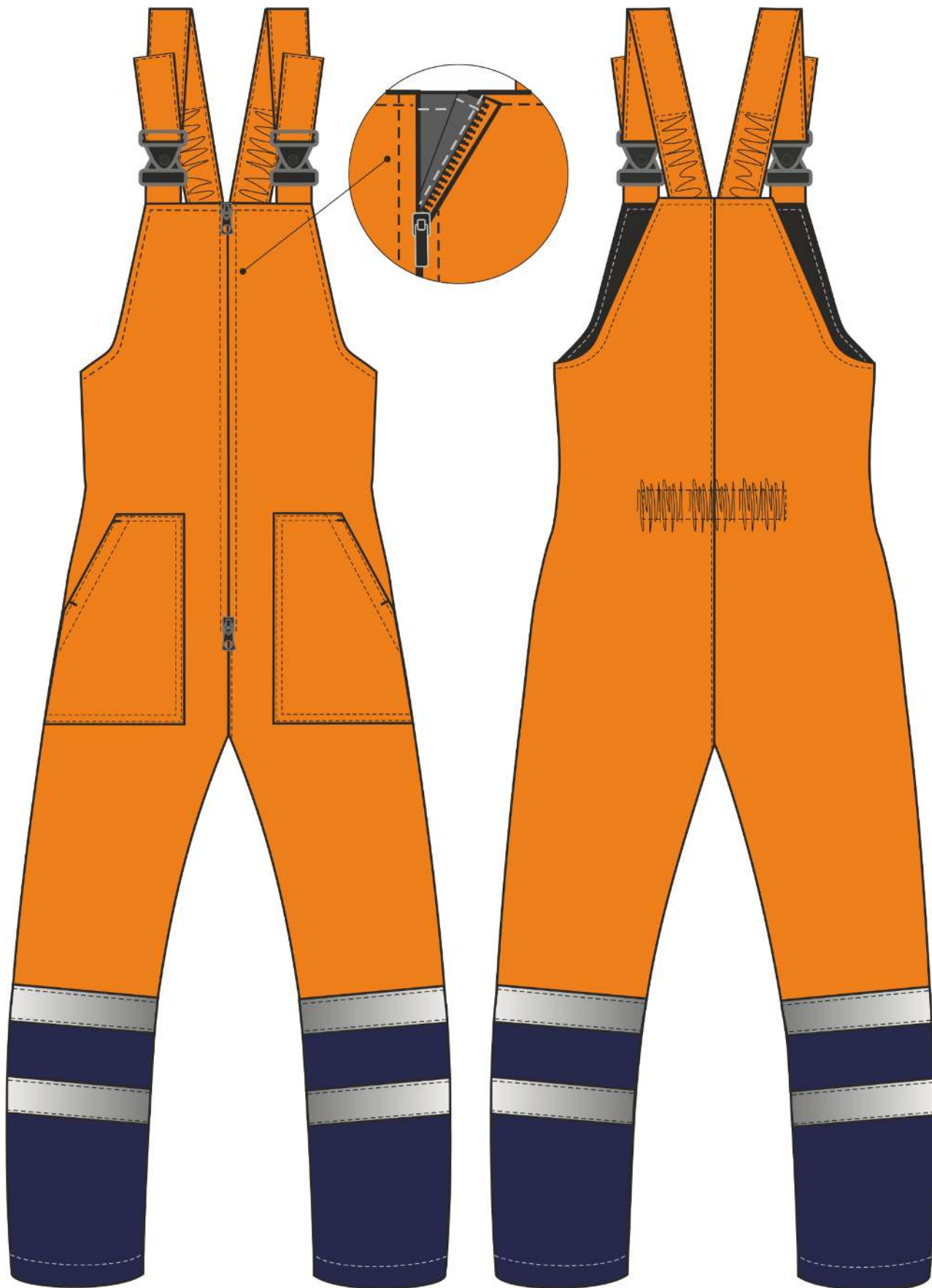
Рис.3. Эскиз Костюм зимний Дорожник-Ультра (тк.Смесовая,210) п/к, оранжевый/т.синий. Полукомбинезон, вид спереди и сзади.