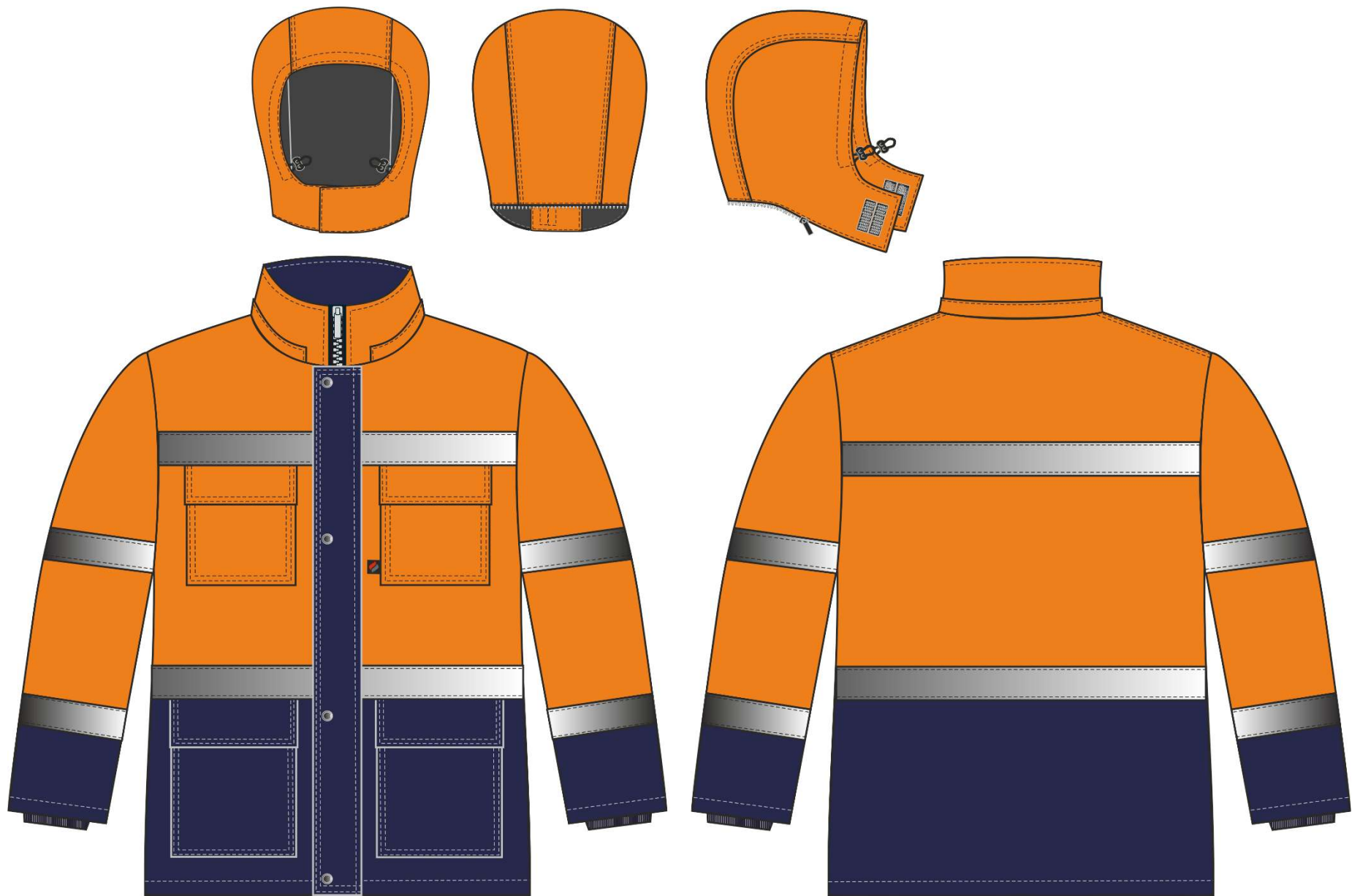
Рис.1. Эскиз Костюм зимний Дорожник-Ультра (тк.Смесовая,210) п/к, оранжевый/т.синий. Куртка, вид спереди и сзади. Капюшон, вид спереди, сзади и сбоку.