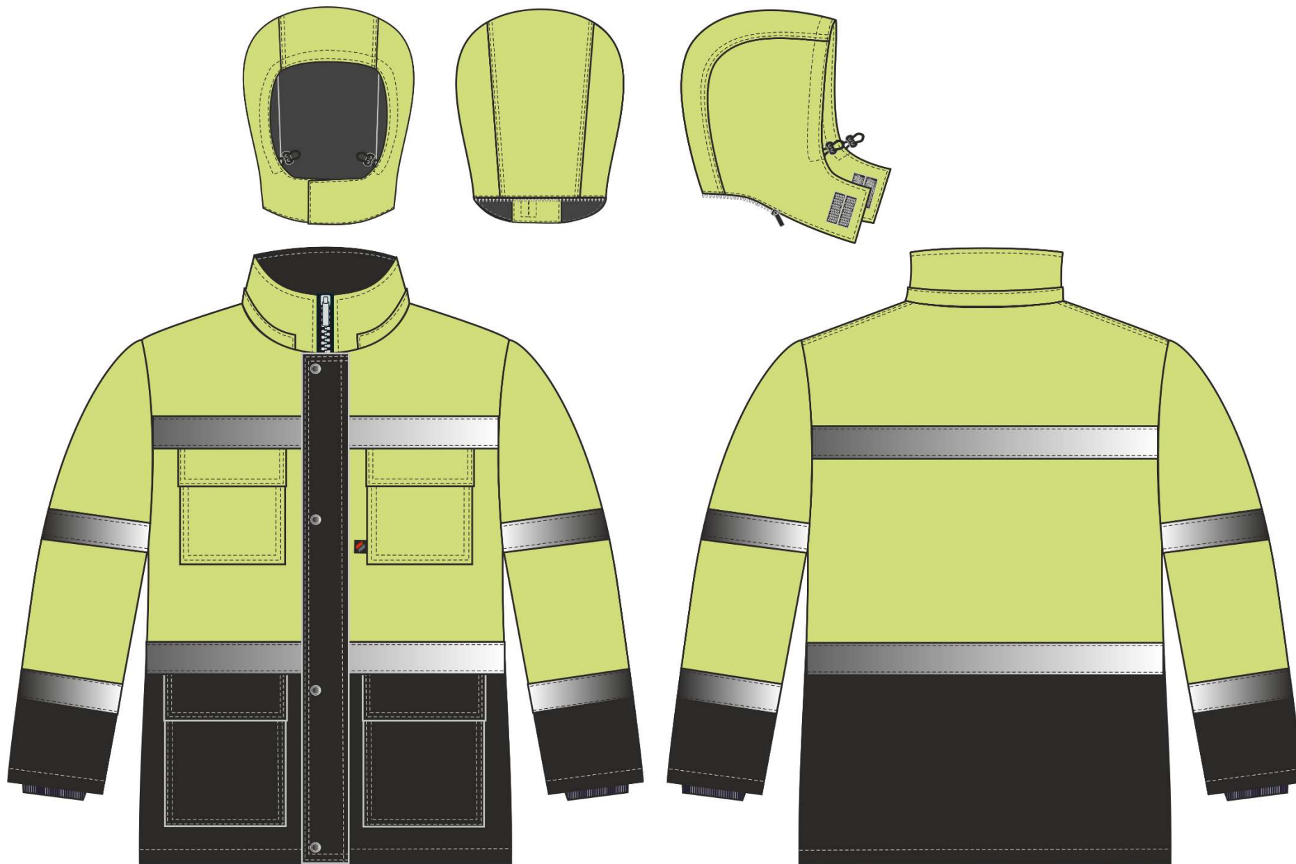
Рис.2. Эскиз Костюм зимний Дорожник-Ультра (тк.Смесовая,210) п/к, лимонный/черный. Куртка, вид спереди и сзади. Капюшон, вид спереди, сзади и сбоку.