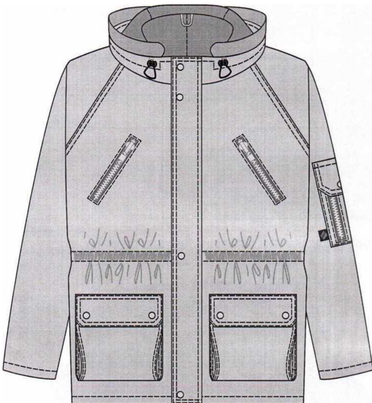
Рис.1. Куртка зимняя Аляска (тк. Оксфорд). Вид спереди.