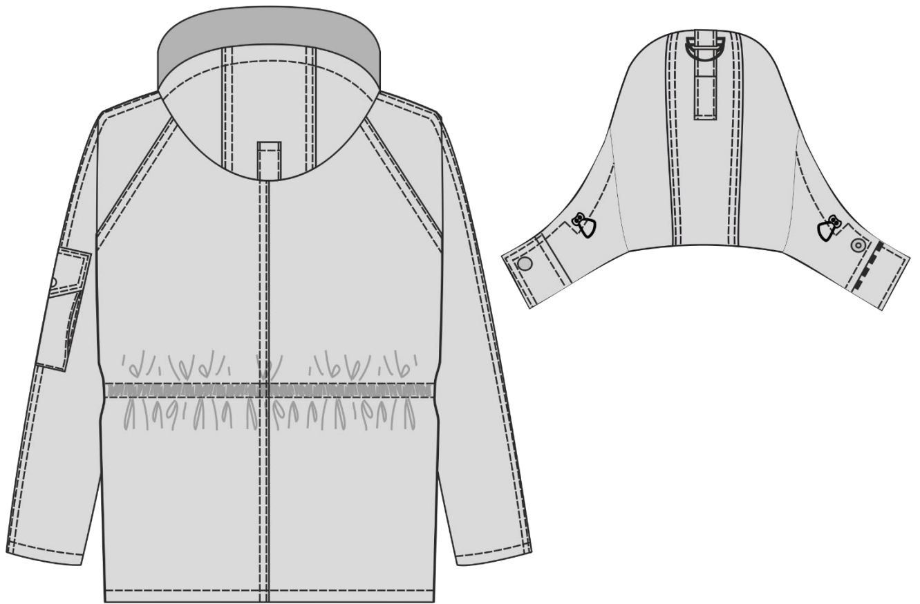
Рис.2. Куртка зимняя Аляска (тк. Оксфорд). Вид сзади.