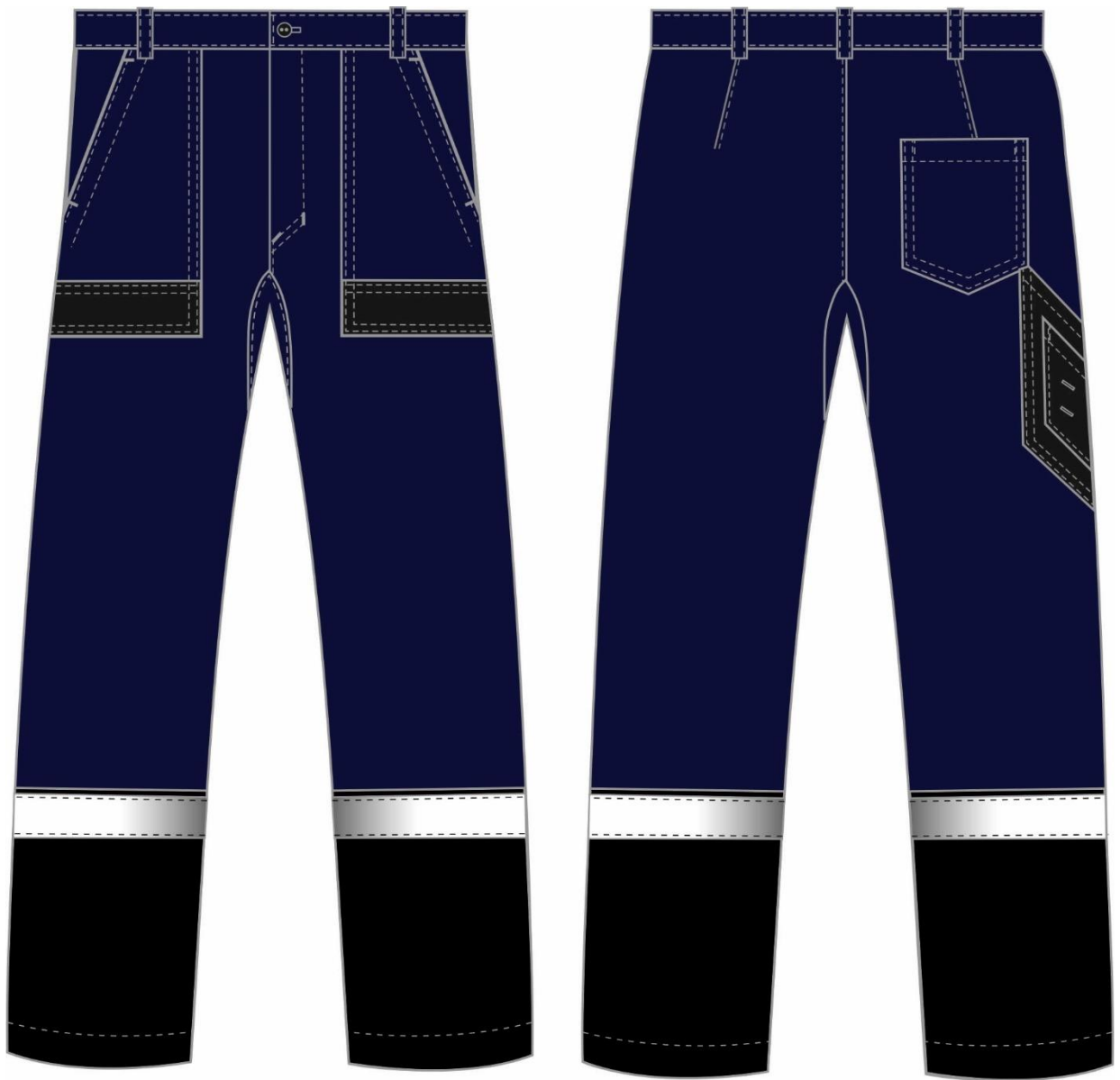
Рис.2. Эскиз Костюм Виват-1 Премиум UZ (тк.Смесовая,240) брюки, т.синий/черный/васильковый, брюки. Вид спереди и сзади.