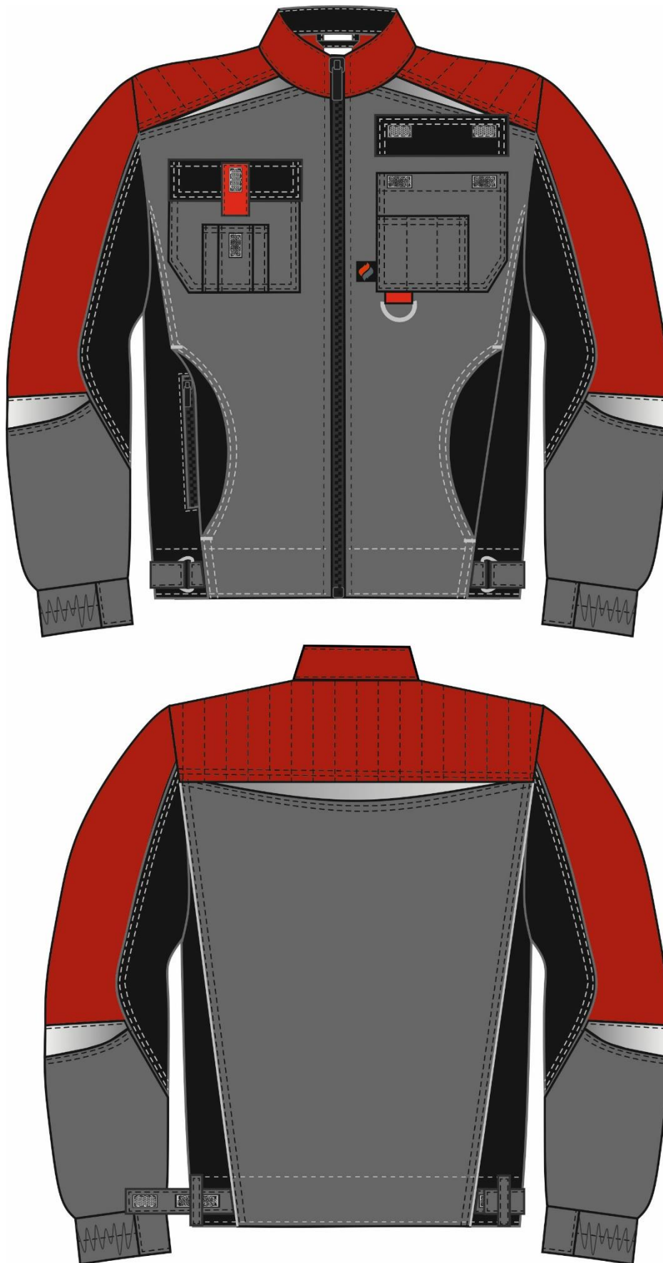
Рис.1. Эскиз Костюм Формула UZ (тк.Смесовая,240) брюки, серый/красный/черный. Куртка, вид спереди и сзади.