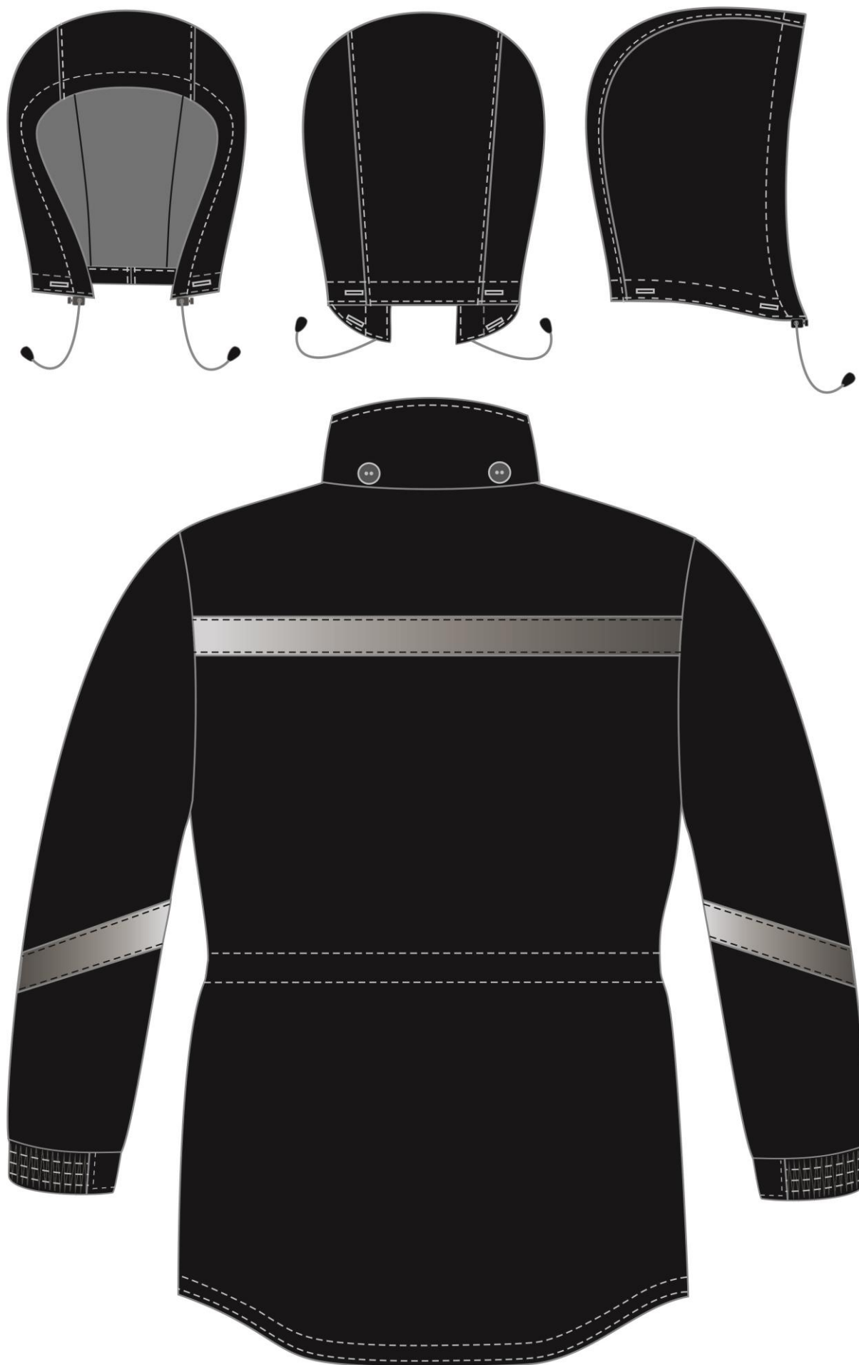
Рис. 6. Эскиз Куртка зимняя Прогресс (тк.Оксфорд), черный. Вид сзади