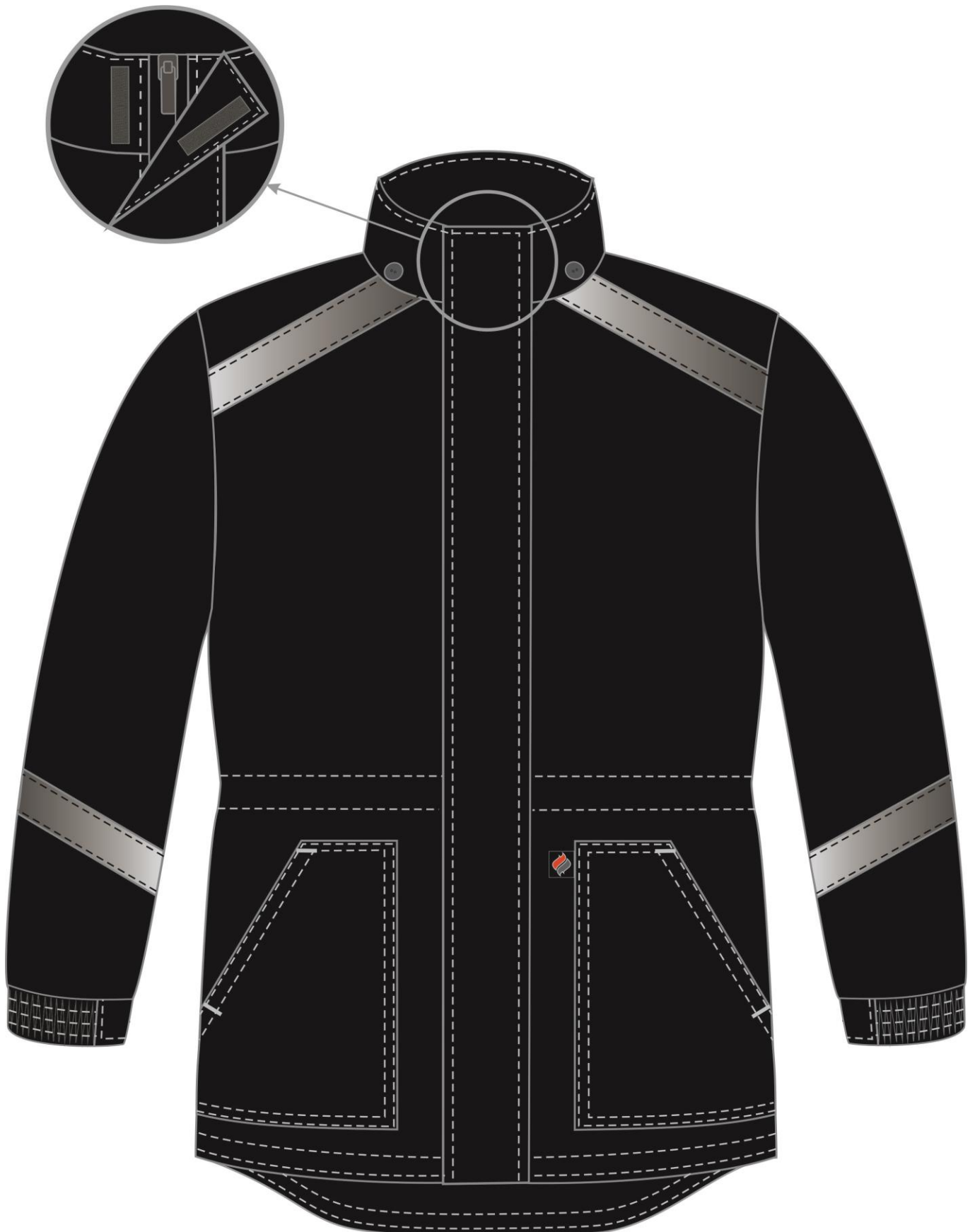
Рис. 5. Эскиз Куртка зимняя Прогресс (тк.Оксфорд), черный Вид спереди.