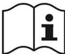
Рисунок 3 - Пиктограмма