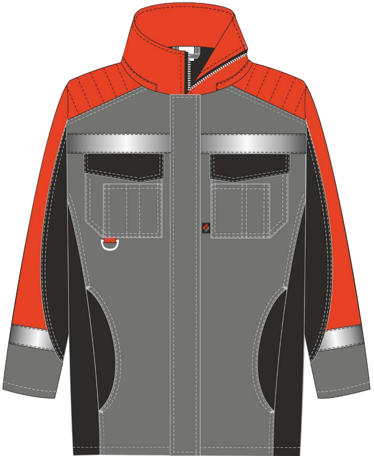
Рис. 1. Эскиз Костюм зимний Фаворит-Мега (тк.Протек,240) п/к, черный/красный/серый, Куртка, вид спереди.