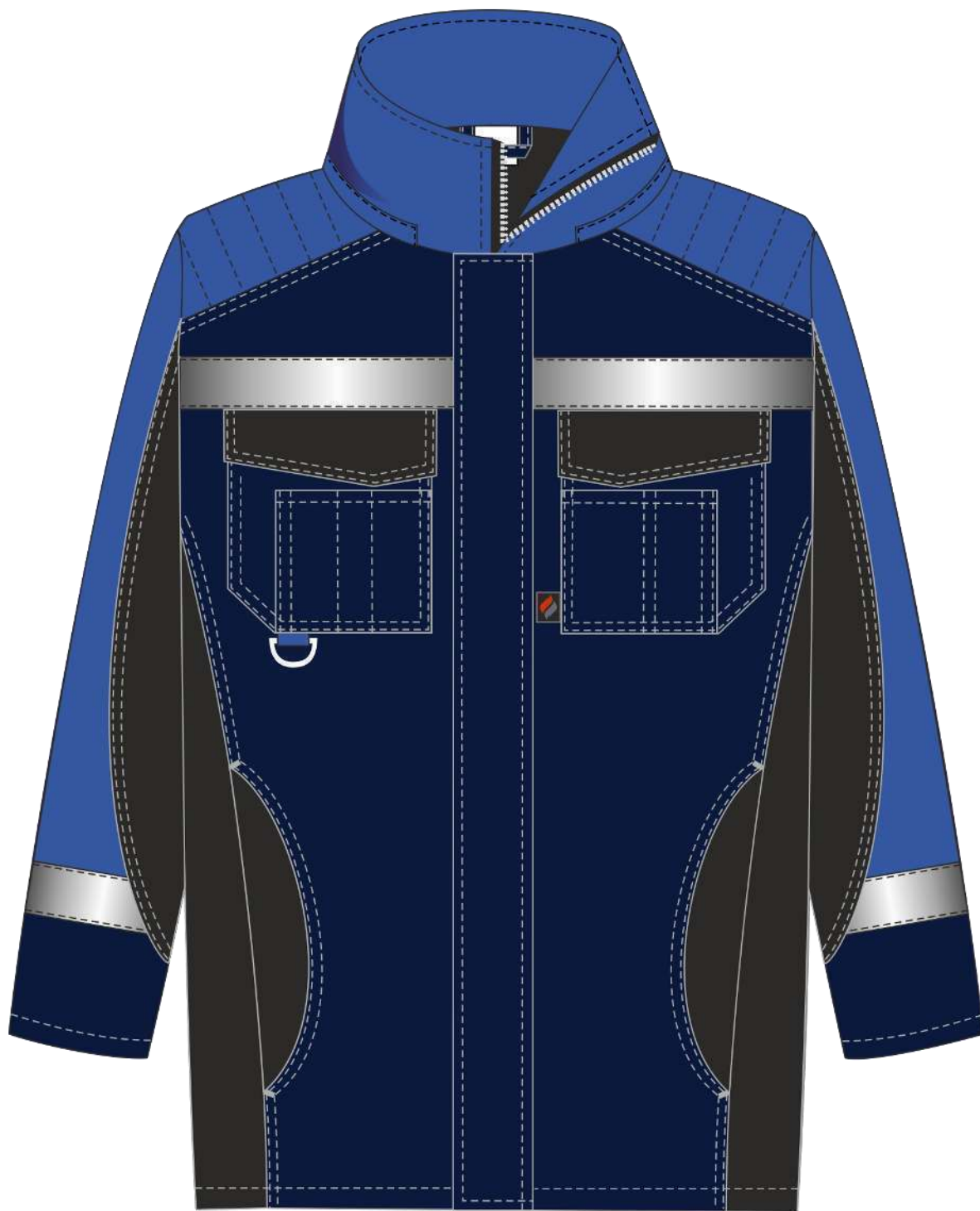
Рис. 5. Эскиз Костюм зимний Фаворит-Мега (тк.Протек,240) п/к, т.синий/черный/васильковый. Куртка, вид спереди.