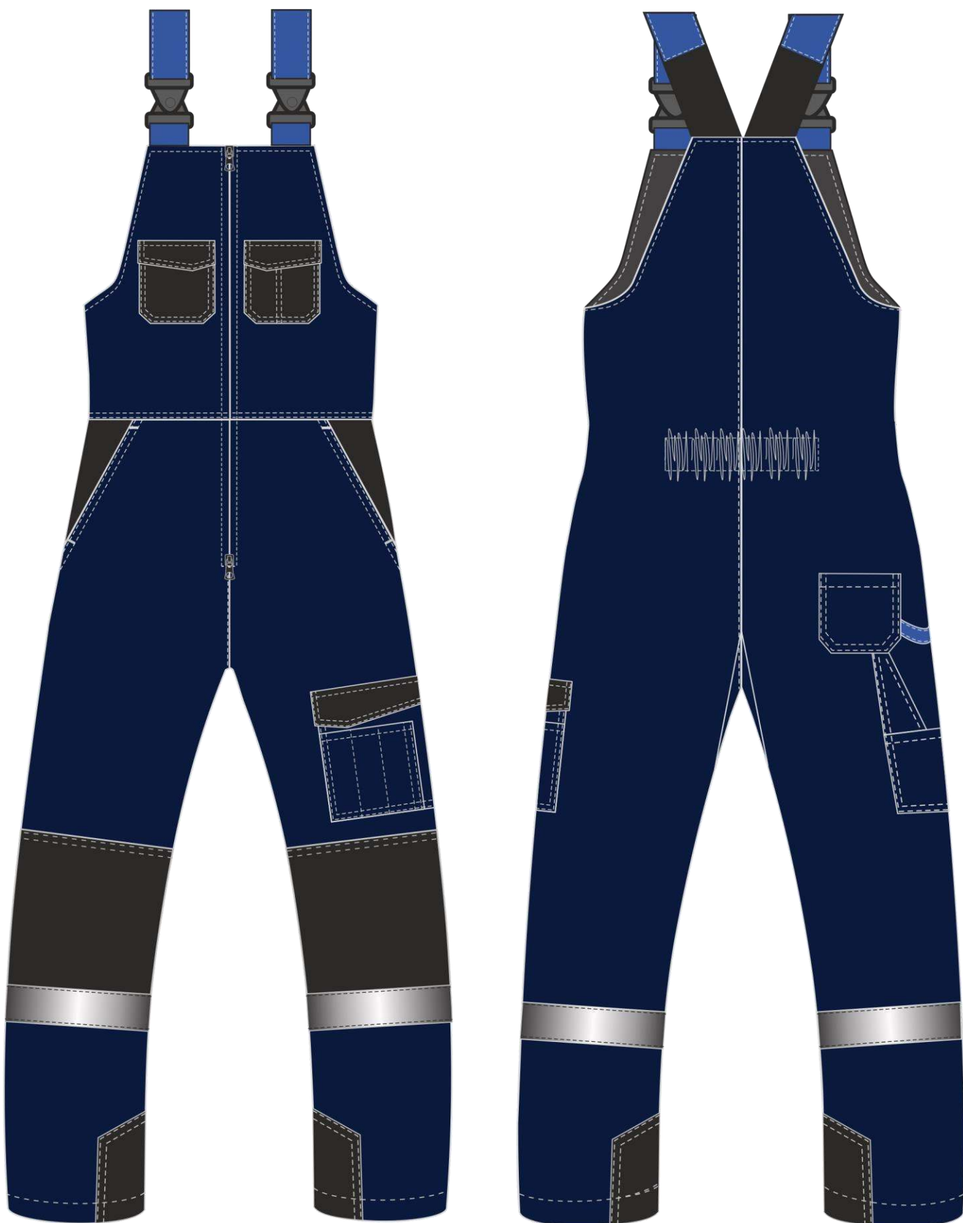
Рис. 8. Эскиз Костюм зимний Фаворит-Мега (тк.Протек,240) п/к, т.синий/черный/васильковый. Полукомбинезон, вид спереди и сзади.