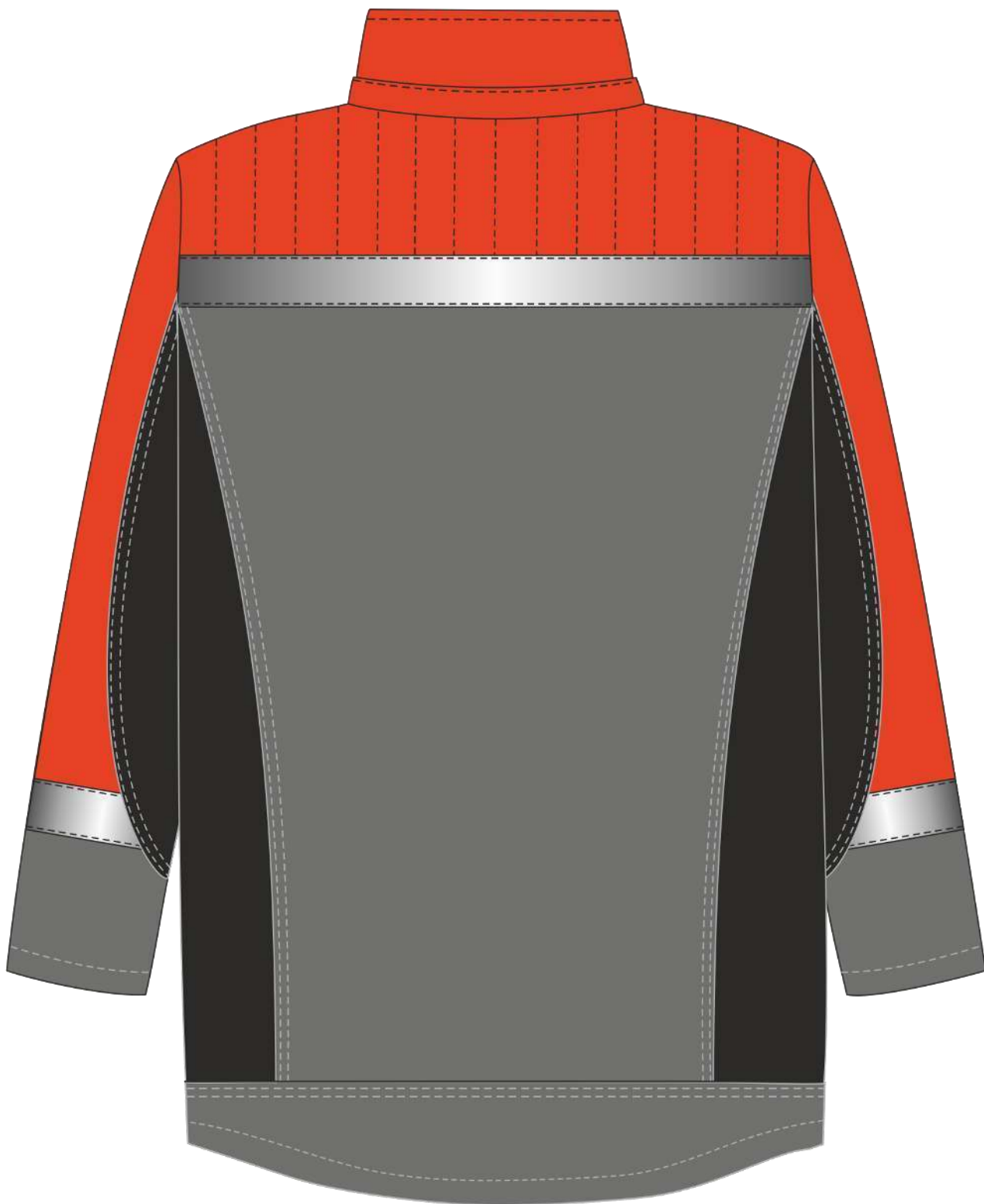
Рис. 2. Эскиз Костюм зимний Фаворит-Мега (тк.Протек,240) п/к, черный/красный/серый Куртка, вид сзади.