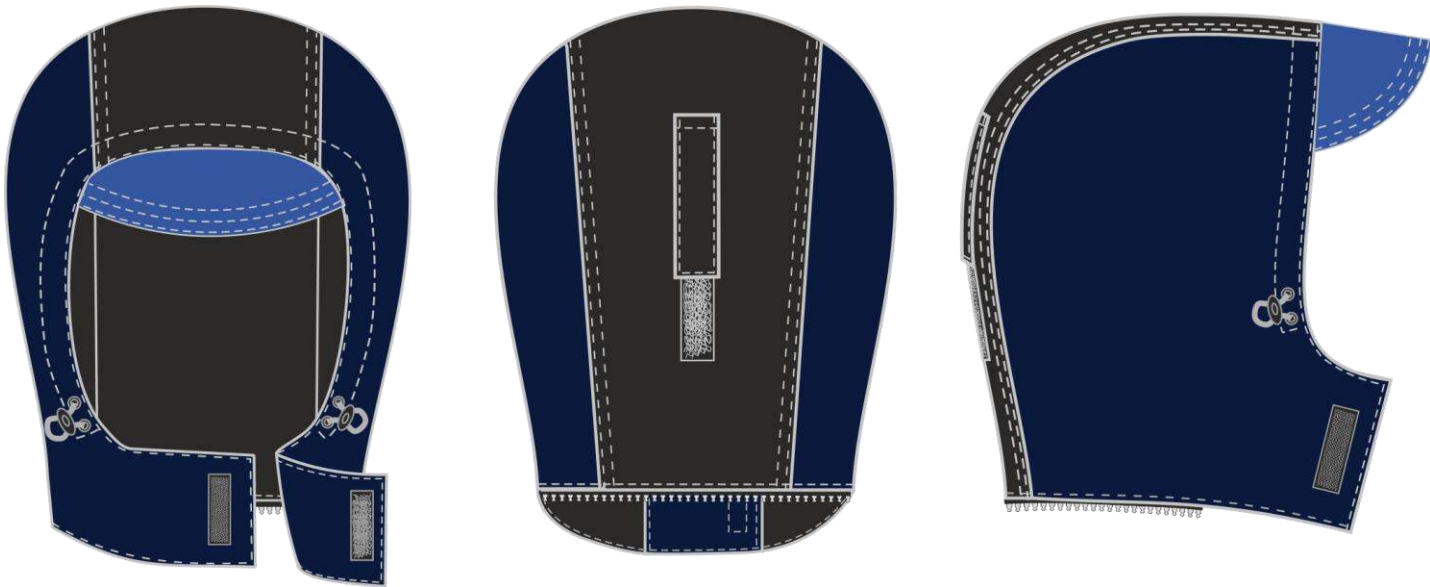
Рис. 7. Эскиз Костюм зимний Фаворит-Мега (тк.Протек,240) п/к, т.синий/черный/васильковый, Капюшон, вид спереди, сзади и сбоку.