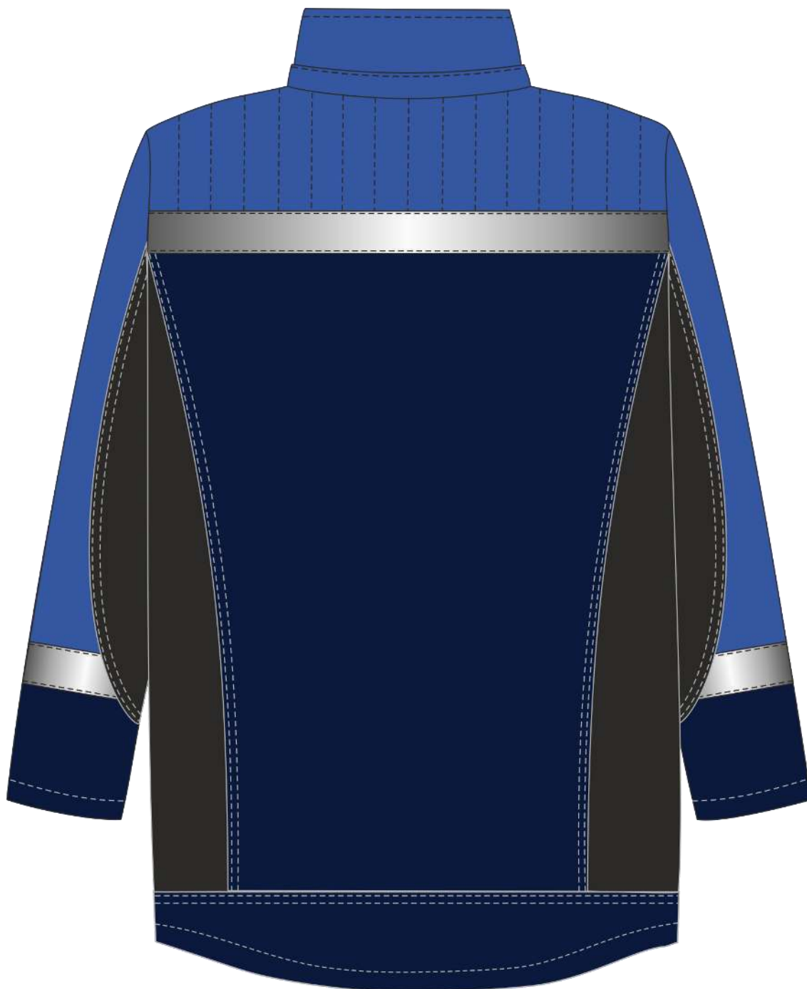
Рис. 6. Эскиз Костюм зимний Фаворит-Мега (тк.Протек,240) п/к, т.синий/черный/васильковый. Куртка, вид сзади.