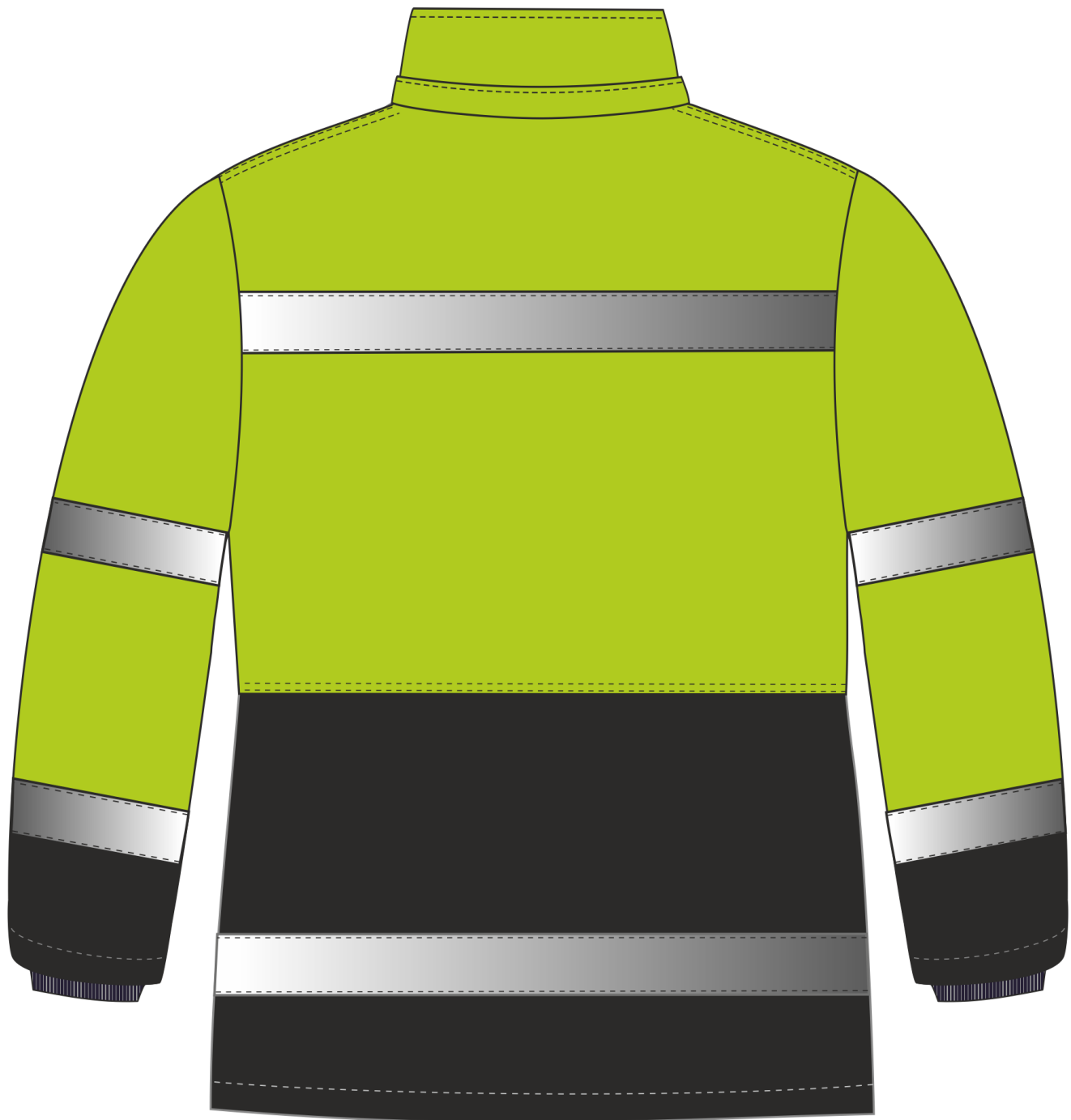
Рис. 2. Костюм зимний Дорожник (тк.Оксфорд) брюки, лимонный/черный, куртка, вид сзади.