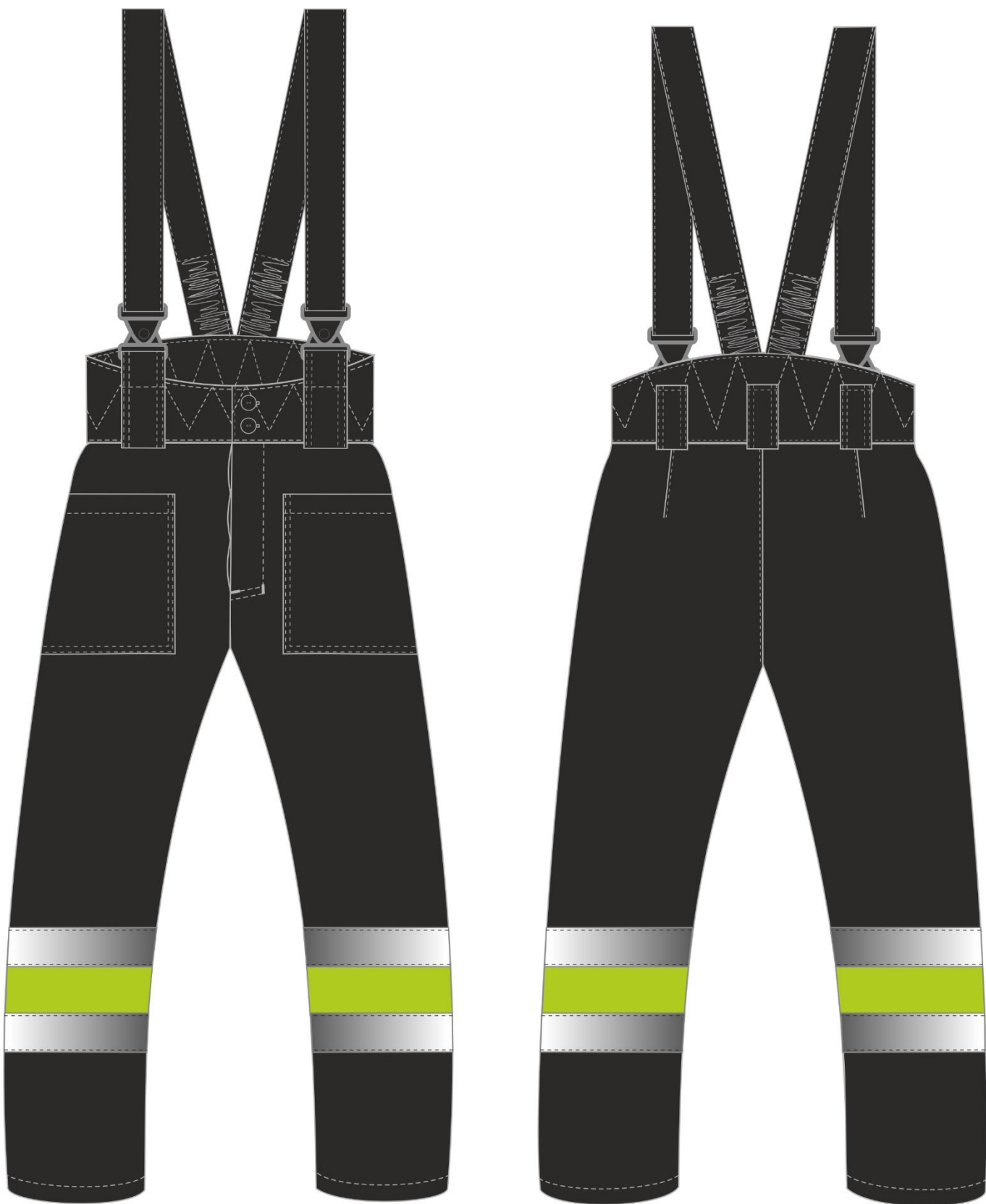
Рис. 3. Костюм зимний Дорожник (тк.Оксфорд) брюки, лимонный/черный, брюки, вид спереди и сзади.