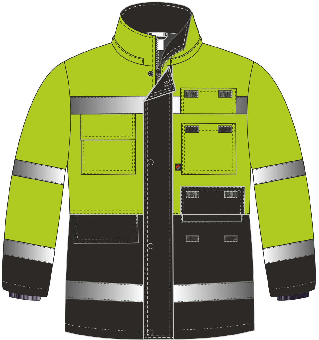
Рис. 1. Костюм зимний Дорожник (тк.Оксфорд) брюки, лимонный/черный, куртка, вид спереди.