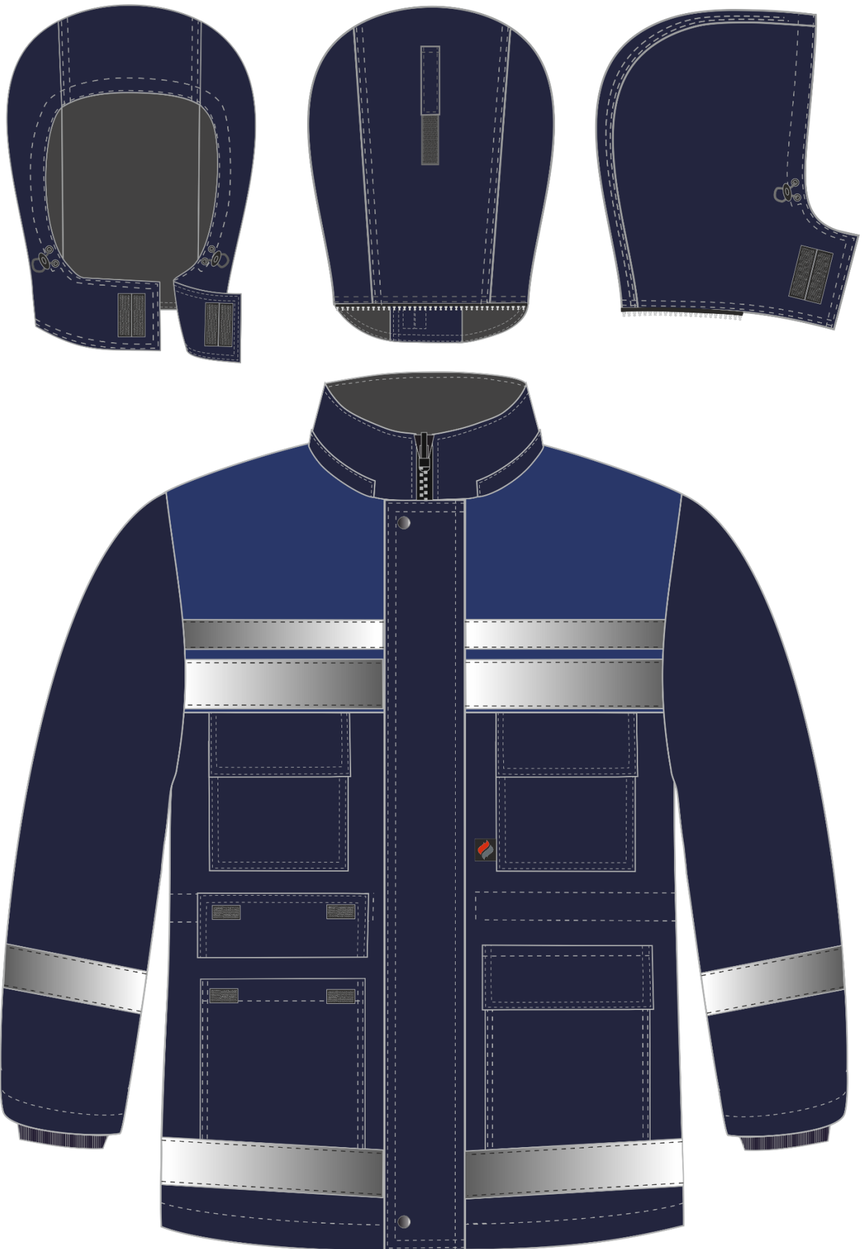
Рис. 1. Эскиз Костюм зимний Горизонт-Люкс (тк.Смесовая,210) брюки, т.синий/васильковый, куртка. Вид спереди