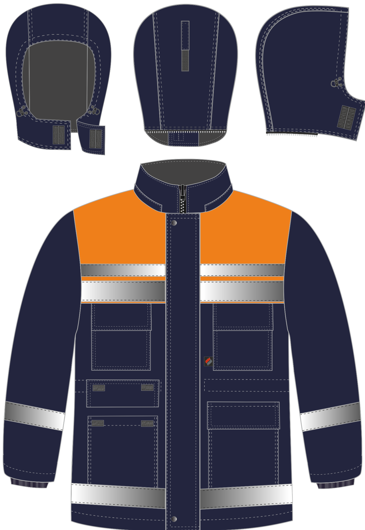
Рис. 3. Эскиз Костюм зимний Горизонт-Люкс (тк.Смесовая,210) брюки, т.синий/оранжевый, куртка. Вид спереди