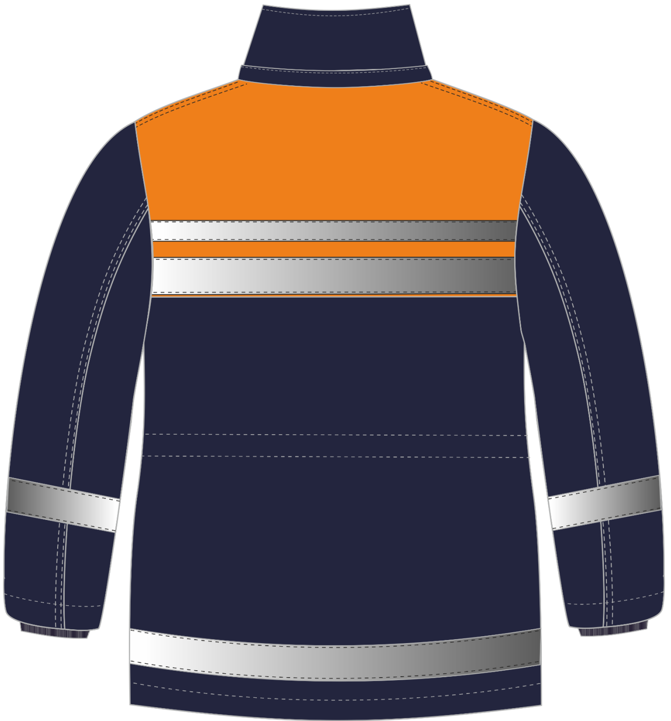
Рис. 4. Эскиз Костюм зимний Горизонт-Люкс (тк.Смесовая,210) брюки, т.синий/оранжевый, куртка. Вид сзади.