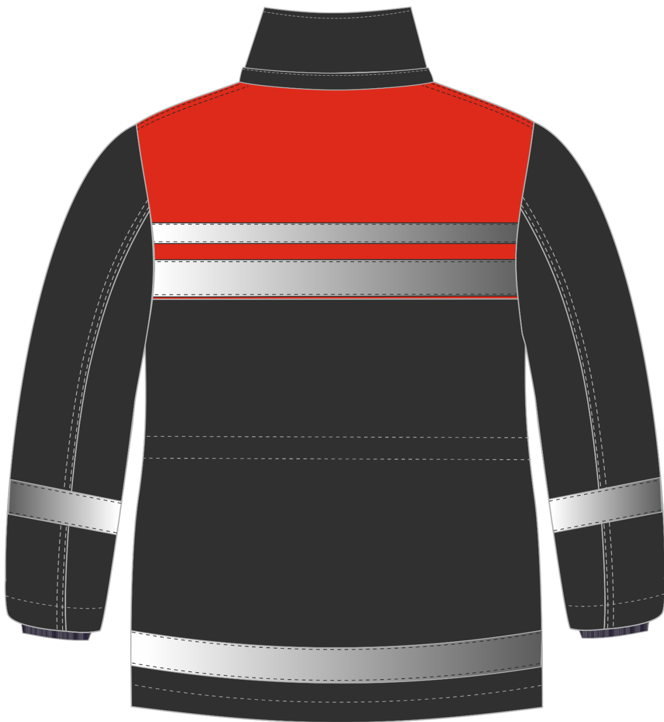
Рис. 6. Эскиз Костюм зимний Горизонт-Люкс (тк.Смесовая,210) брюки, т.серый/красный, куртка. Вид сзади.