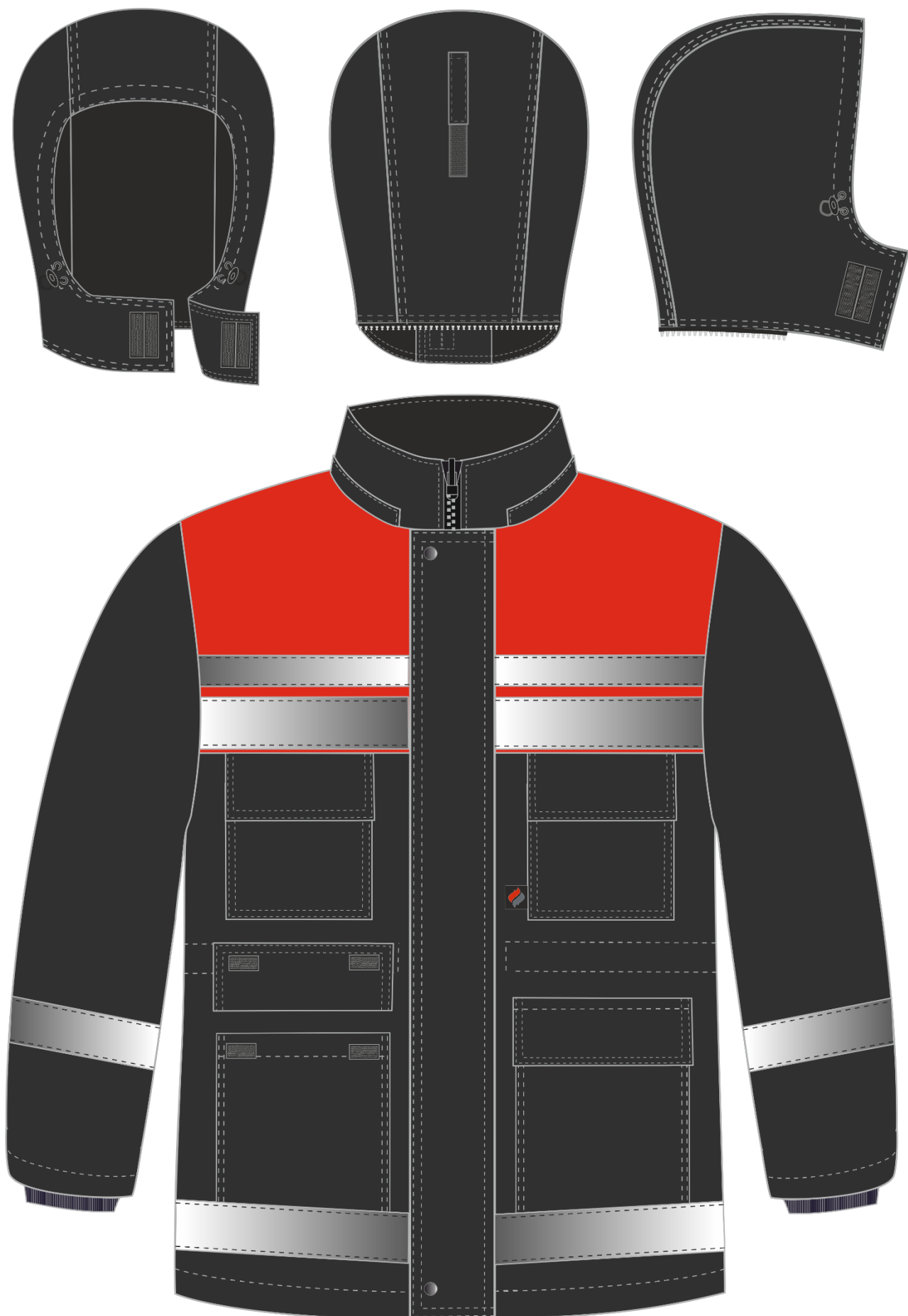
Рис. 5. Эскиз Костюм зимний Горизонт-Люкс (тк.Смесовая,210) брюки, т.серый/красный, куртка. Вид спереди