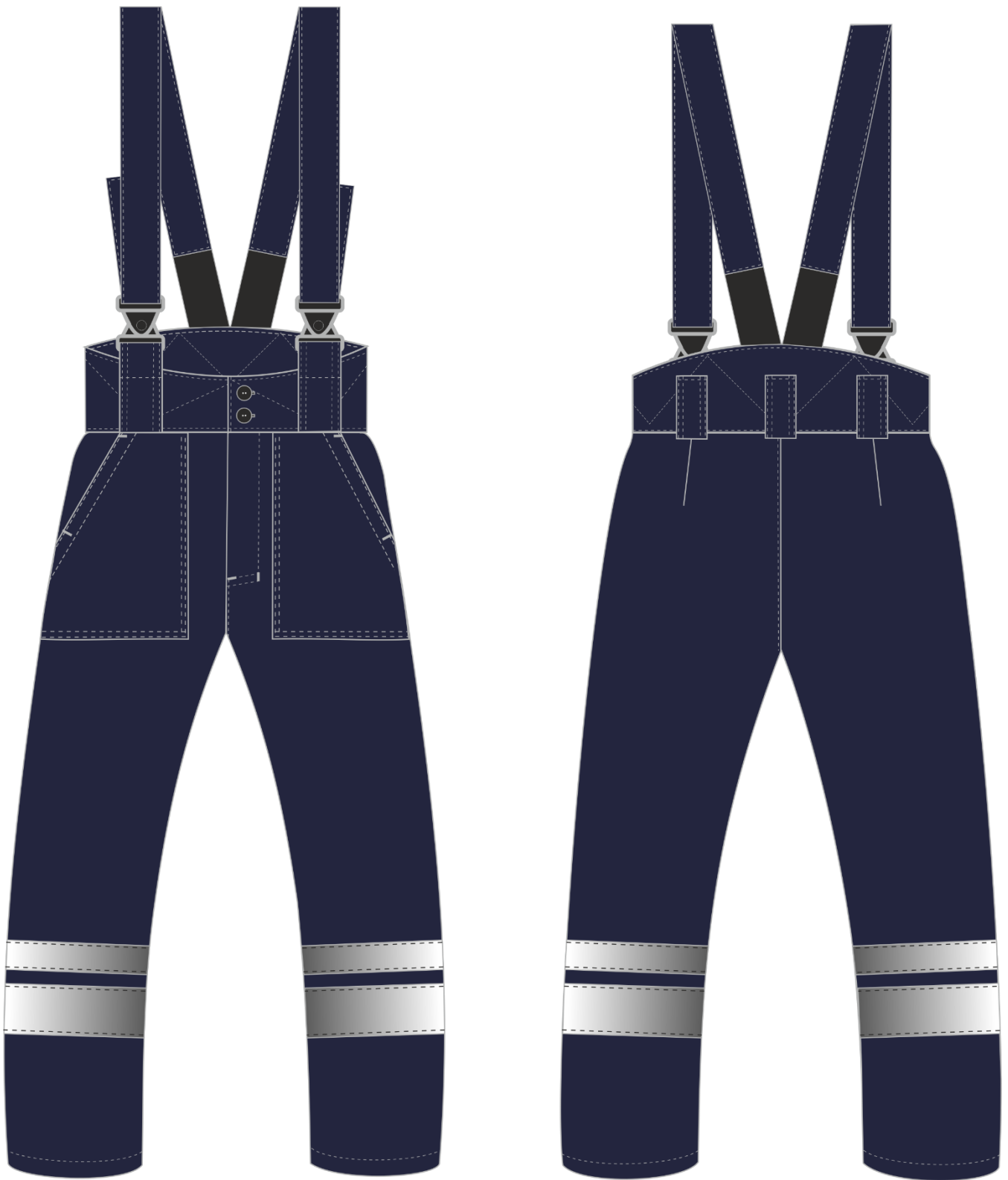
Рис. 7. Эскиз Костюм зимний Горизонт-Люкс (тк.Смесовая,210) брюки, т.синий/васильковый (т.синий/оранжевый),брюки. Вид спереди и сзади.