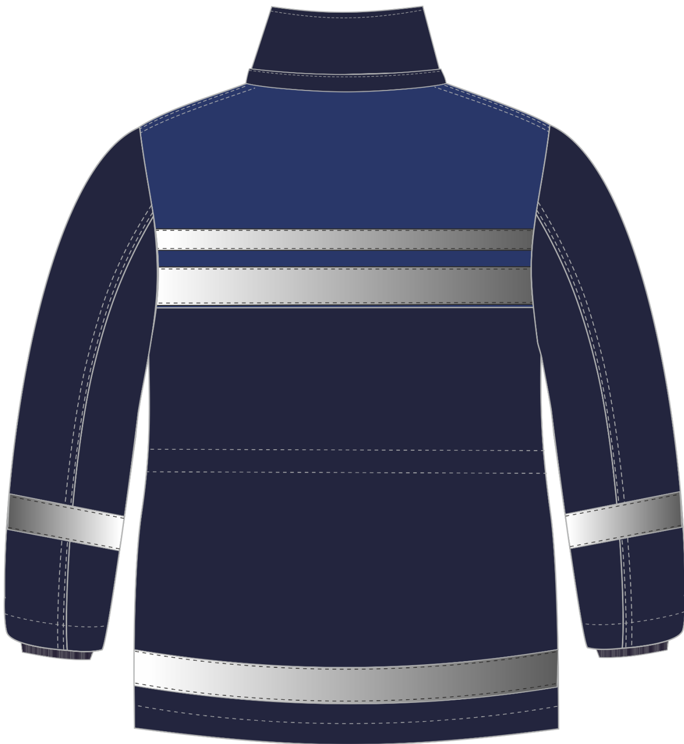
Рис. 2. Эскиз Костюм зимний Горизонт-Люкс (тк.Смесовая,210) брюки, т.синий/васильковый, куртка. Вид сзади