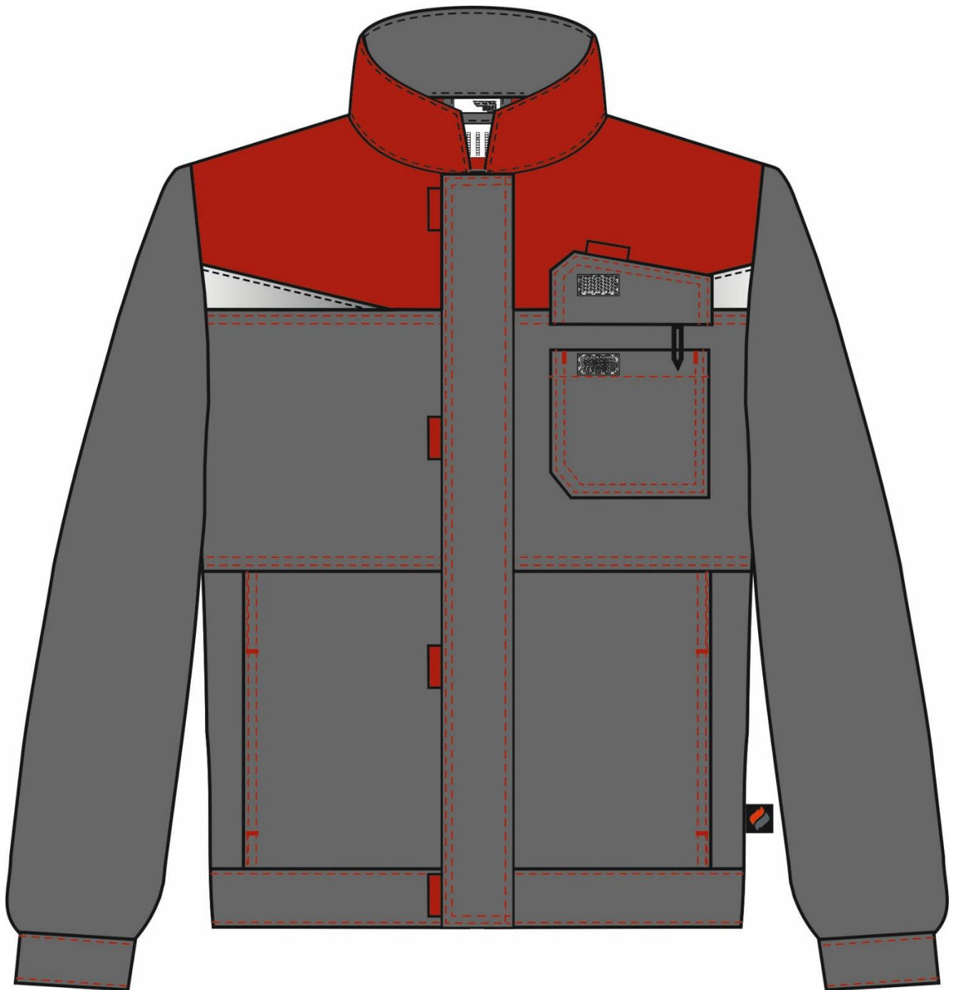
Рис. 1. Эскиз Костюм Строй-2 (тк.Смесовая,240) п/к, т.серый/красный/черный. Куртка, вид спереди.