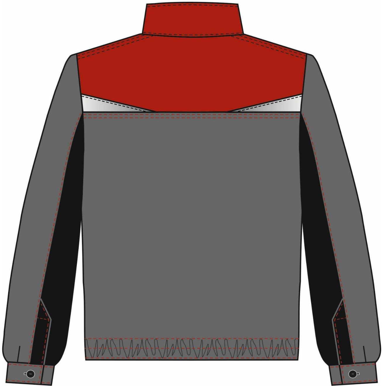
Рис. 2. Эскиз Костюм Строй-2 (тк.Смесовая,240) п/к, т.серый/красный/черный.. Куртка, вид сзади.